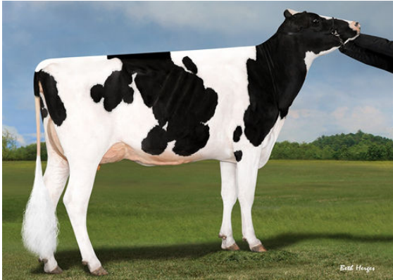
SYNERGY RUBICON PERFECT FOURTH DAM